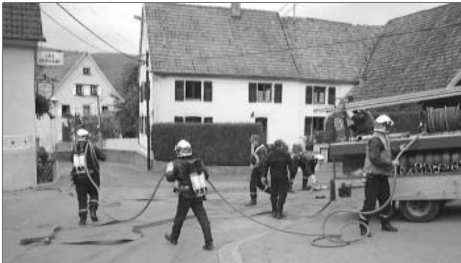
1999: Les Pompiers en exercice à l'Hôtel Illienkopf