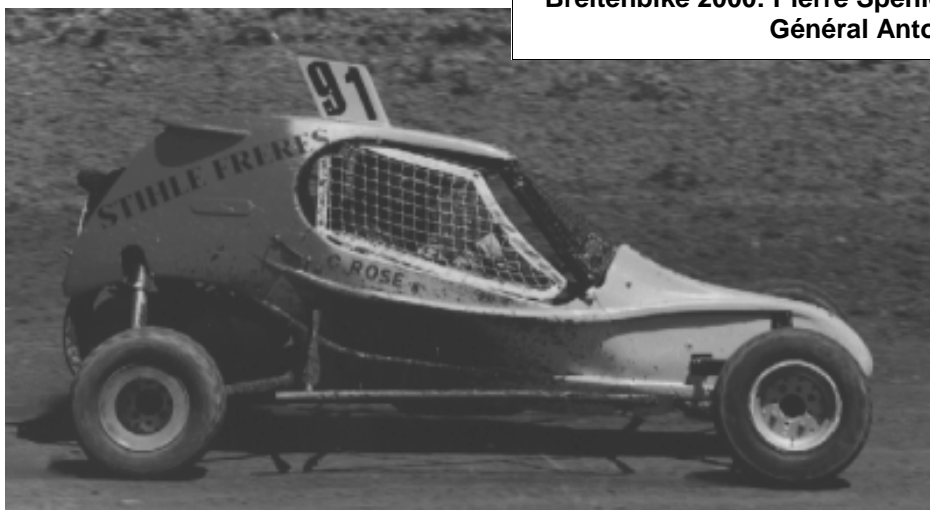
La voiture de Christophe