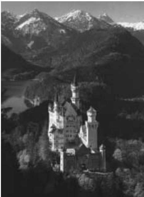
château de Neuschwanstein

C'est sur la route allemande des Alpes, "Deutsche Alpenstrasse", que les Alpes offrent les plus beaux paysages; de plus, aux sites splendides, s'ajoutent les châteaux