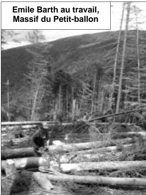
Emile Barth au travail, Massif du Petit-ballon

◇ Voirie: Après le difficile chantier de la Place des Exercices, les choses se sont un peu calmées! L'abri bus a fini par arriver, les enrobés ont été posés autour du nouveau mur de l'école qui devrait recevoir son portail et ses