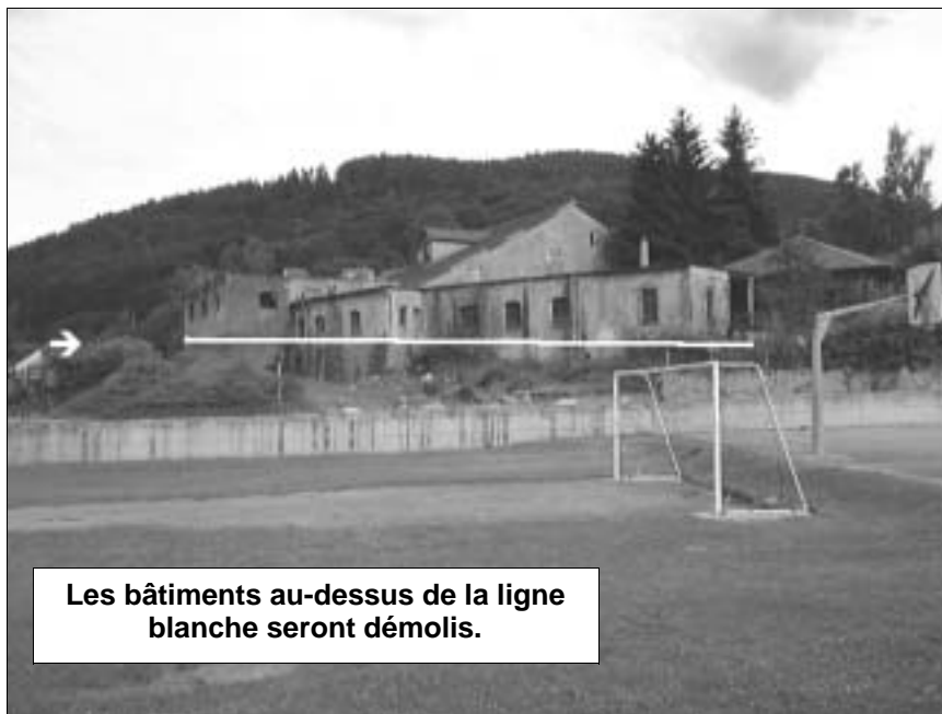
Les bâtiments au-dessus de la ligne blanche seront démolis.

que la future Salle polyvalente. La facturation des parties privatives du réseau assainissement des rues de l'Eckersberg et du Réservoir interviendra très prochainement. La commune avait pris la maîtrise d'ouvrage de ces travaux pour permettre aux