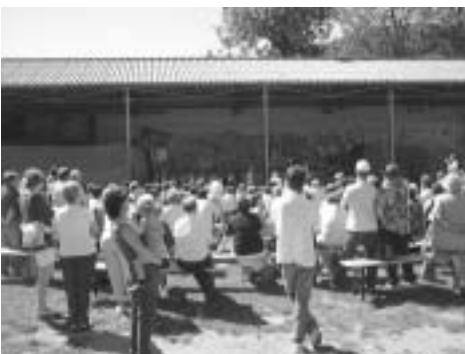
La Fête de l'École organisée par les écoles maternelle et primaire sous un soleil radieux, à connu la grande foule.