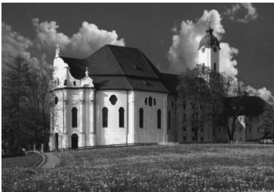
La très belle église baroque de Wies.

il fait nuit quand nous franchissons la célèbre porte de l'an 2000 de Breitenbach, la tête pleine de souvenirs ensoleillés.