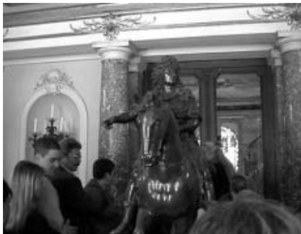
Linderhof: le Président des Donneurs de sang rencontre Louis XIV.

Steingaden, Füssen, Immenstadt, Luindenberg, Bregenz (entrée en Suisse: sans problème)