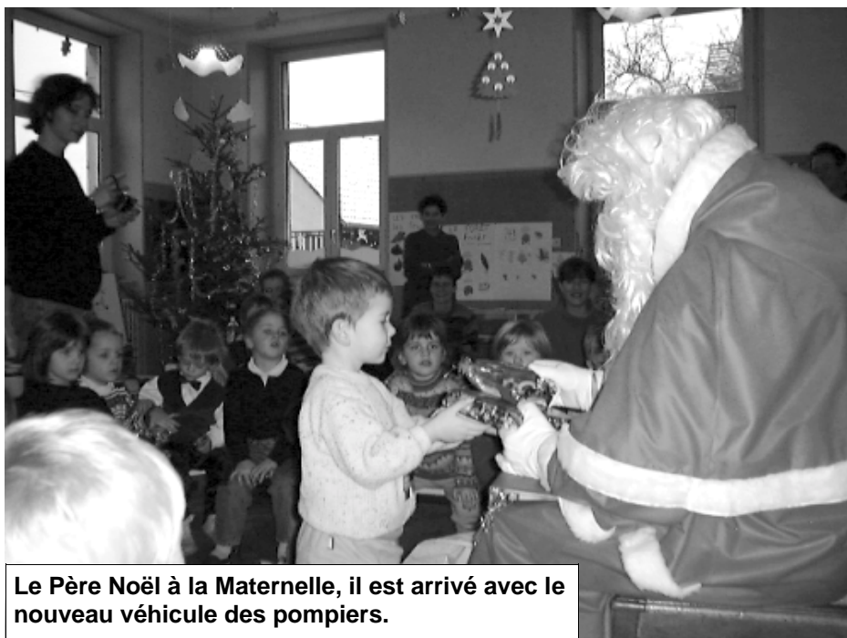
Le Père Noël à la Maternelle, il est arrivé avec le nouveau véhicule des pompiers.