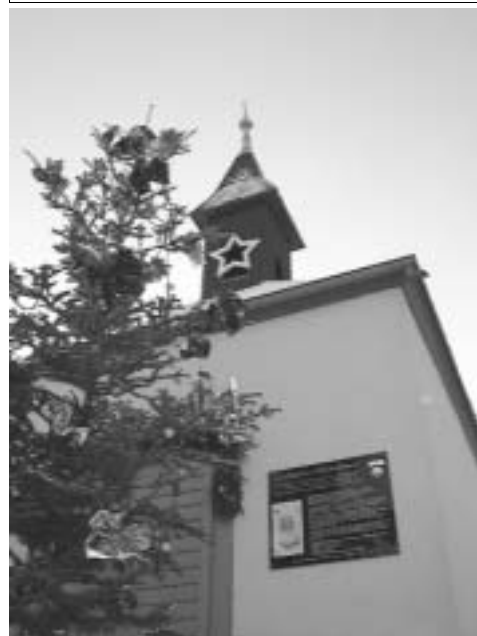
La chapelle d'Oberbreitenbach

✎ Oberbreitenbach: Une plaque racontant la légende de la Cloche a été apposée sur la chapelle, c'est le moment d'y aller voir car les habitants du hameau ont décoré la chapelle et le sapin de Noël devant la chapelle.