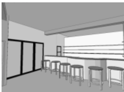
Vue sur le Bar.

Les grandes et nombreuses fenêtres du bâtiment éclaireront une salle de près de 300 m 2 . Originalité du projet, l'architecte nous a proposé de mettre la scène à l'ouest de la salle pour profiter de la