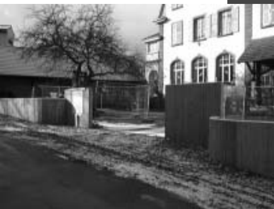
Le nouveau mur de l'école primaire.

moitié du prix des luminaires qui devraient briller avant la fin de l'année!! L'abri bus devrait arriver sous peu. A l'école, après avoir dû complètement modifier le projet initial concernant le mur de la cour (la récupération des matériaux anciens s'est avérée impossible), le chantier avance.