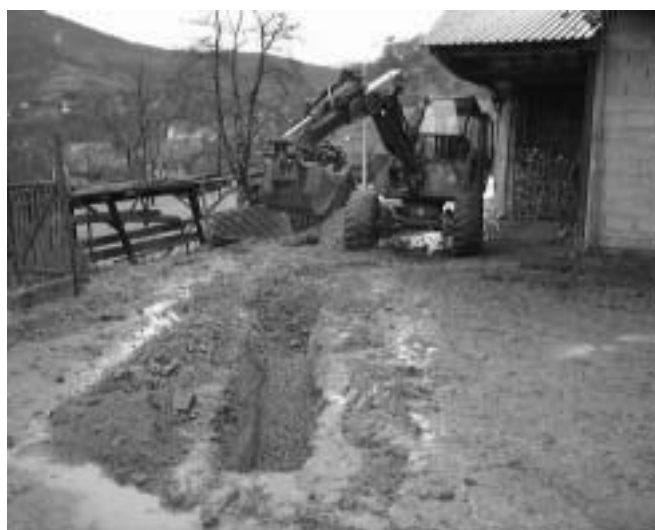
Assainissement rue du Breuil

programme rue de l'Eckersberg et du Réservoir est achevé, le réseau d'eau potable est maintenant entièrement neuf dans ces rues et un réseau d'assainissement séparant les eaux claires et les eaux usées a été mis en place. En Septembre c'est au tour de la rue des Prés de subir les affres d'un