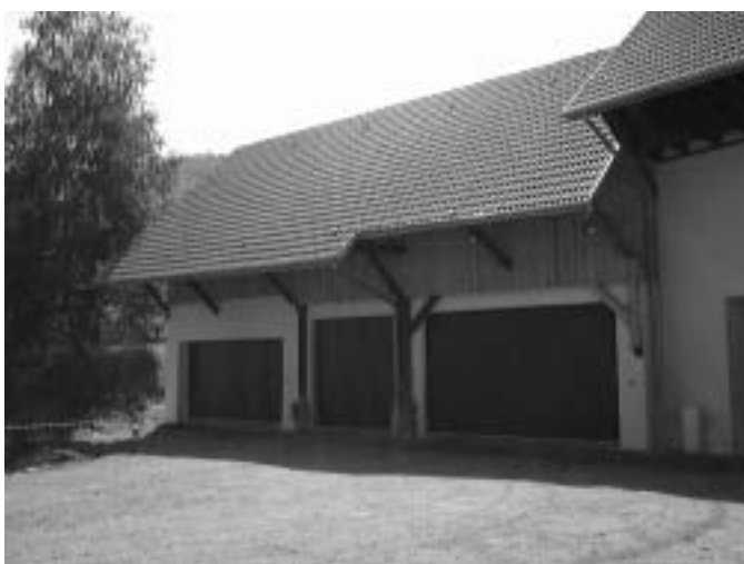
Les nouveaux ateliers

◇ "Ancienne Brasserie": Le chantier se termine, il ne