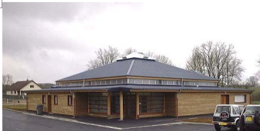
Salle multiactivité à Saint-Blain.

Une cordiale invitation est lancée à tous pour venir visiter "Les Nussakracher" le samedi 31 août 2002 de 14 heures à 17 heures.