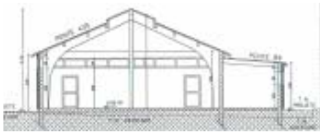
Coupe sur travers.