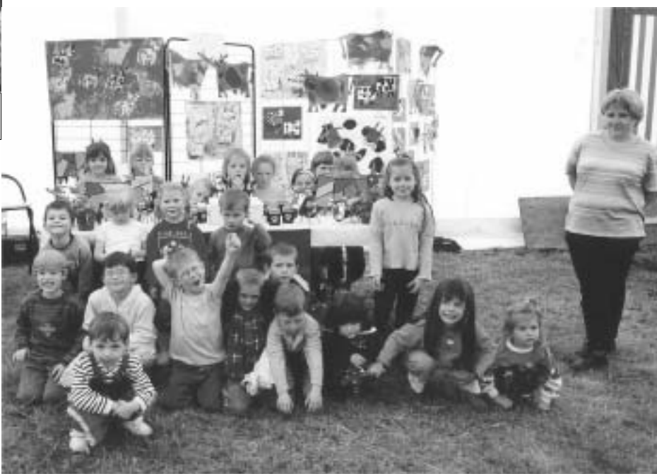
Les élèves de l'école maternelle présentent leur travail sur les vaches.