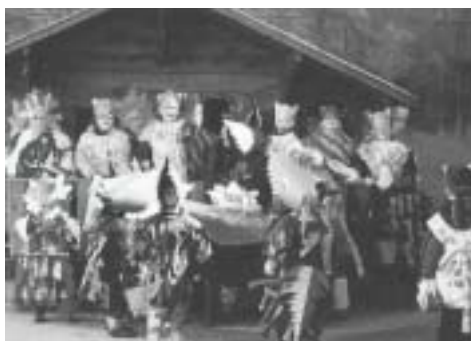
Mardi gras chez les petits.