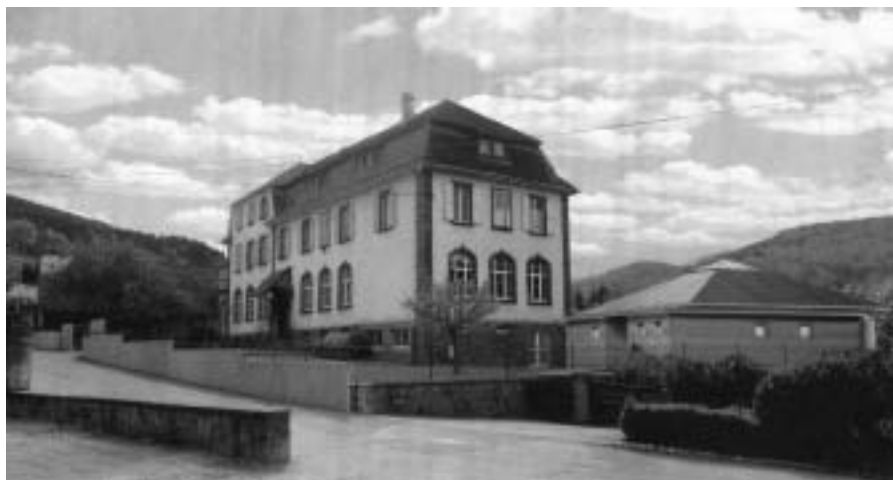
Insertion dans le site du futur bâtiment, tel que l'architecte l'a prévu.