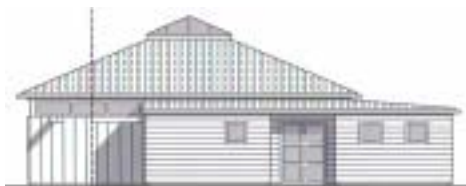
La façade vers la cour de l'école.

En étroite collaboration avec le Conseil Municipal, un groupe de travail a étudié les différentes solutions possibles. Nous avons consulté en particulier la Caisse d'Allocation Familiale, l'Inspection d'Académie, les Conseils d'école et les parents. Nous avons également visité 3 structures périscolaires récentes et en avons exploré la problématique avec les