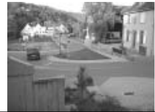
Le petit coin de gazon au centre de la photo accueillera la fontaine