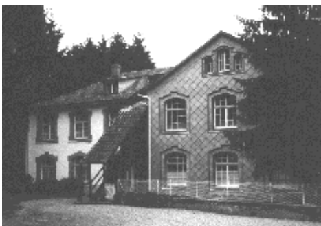
Aspect actuel des bâtiments.

Propos recueillis par Victor PRAOUTINE auprès de Mme Suzanne ERTLE - 11/2001