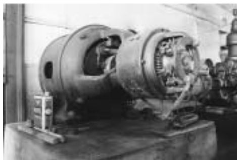
L'alternateur pour la production de courant

n'existait plus. Reconstruire le tissage ? Ce n'était pas la priorité alors qu'il manquait de maisons et d'édifices publics.