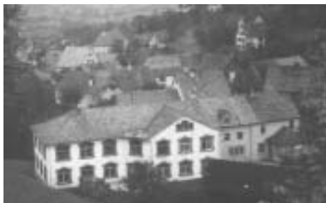
Les bâtiments avant l'installation des Hollandais.

Se souvient-on qu'avant 1914, dans le haut du village, à l'actuel n° 6 rue Erlenbach, se trouvait un