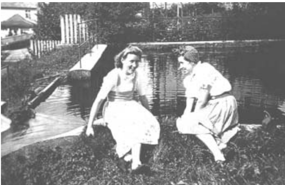
L'étang barrage avec l'écluse quand elle était en fonction

Les générations passent, les activités changent, l'immeuble est à nouveau vacant et attend celui qui saura lui redonner vie et âme et apporter ainsi un plus à la vie de la Commune.