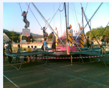
Quelques images de 2003, 2005 et 2010.

Cette fête est organisée par la municipalité et les associations du village pour les habitants de Breitenbach et leurs familles dans le but de passer ensemble une belle soirée.